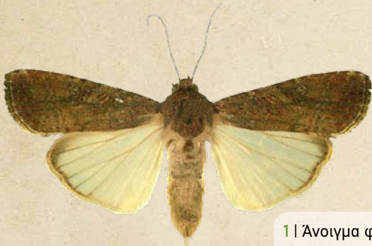
1 | Άνοιγμα φτερών: 20-40mm

ΕΠΙΒΛΑΒΗΣ ΟΡΓΑΝΙΣΜΟΣ ΚΑΡΑΝΤΙΝΑΣ ΠΟΥ ΠΡΟΣΒΑΛΛΕΙ ΤΟ ΚΑΛΑΜΠΟΚΙ ΚΑΙ ΠΟΛΛΑ ΑΛΛΑ ΕΙΔΗ