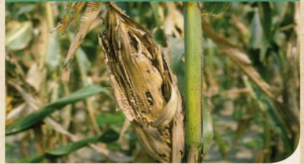
2 | Μήκος προνύμφης: 4 mm-35 mm